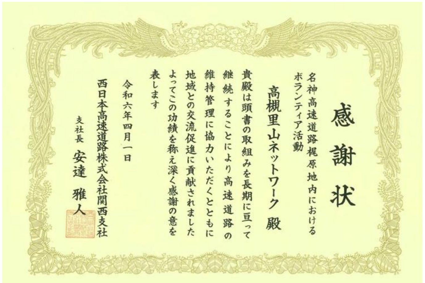
NEXCO関西支部からの感謝状